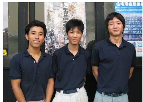
(左からよっちゃん、星くん、早川くん)