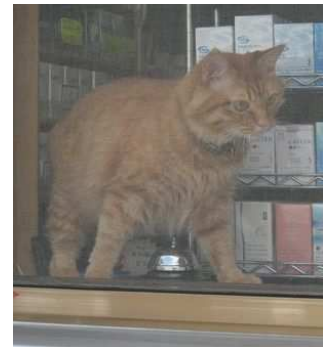
弊社のお隣さんのチャコちゃん。たま～に、お店番をしに出できます♪